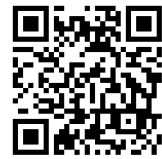
※研究会ホームページ QRコード